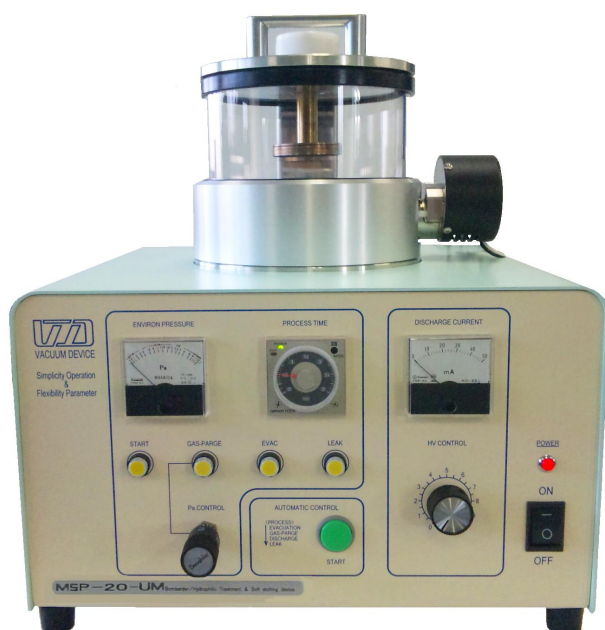
標準試料ステージ部